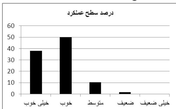
نمودار ۲: سطح عملکرد کارکنان بر حسب درصد در خصوص اصول جایجایی بیماران و تجهیزات مورد استفاده

نمره عملکرد شرکت کنندگان در مطالعه، در محدوده ۸ تا ۲۵ قرار داشت و میانگین نمرات عملکرد آنان 19/275 \pm 3/52 بود. از نظر سطح عملکرد ۱ نفر (۱/۷ درصد) از شرکت کنندگان در سطح ضعیف، ۶ نفر (۱۰/۳ درصد) در سطح متوسط، ۲۹ نفر (۵۰ درصد) در سطح خوب و ۲۲ نفر (۳۷/۹ درصد) در سطح خیلی خوب قرار داشتند (نمودار ۲).